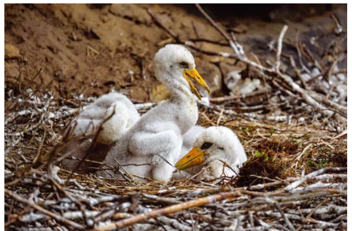
Mláďata čápů černých jsou ještě ve svých hnízdech, potřebují čas do 31. července. Potomstvo sokolů a výrů hnízda již opustilo.

Sokoli stěhovaví letos vyvedli celkem sedmáct mláďat, pět v národním parku a dvanáct v chráněné krajinné oblasti. Celkem zahnízdilo třináct párů, mláďata se podařilo vyvést sedmi z nich. Za hnízdními neúspěchy zbývajících šesti párů stojí převážně přírodní jevy. Ztráty byly způsobeny zejména predátory, například kunou, v jednom případě byl sameček hnízdičího