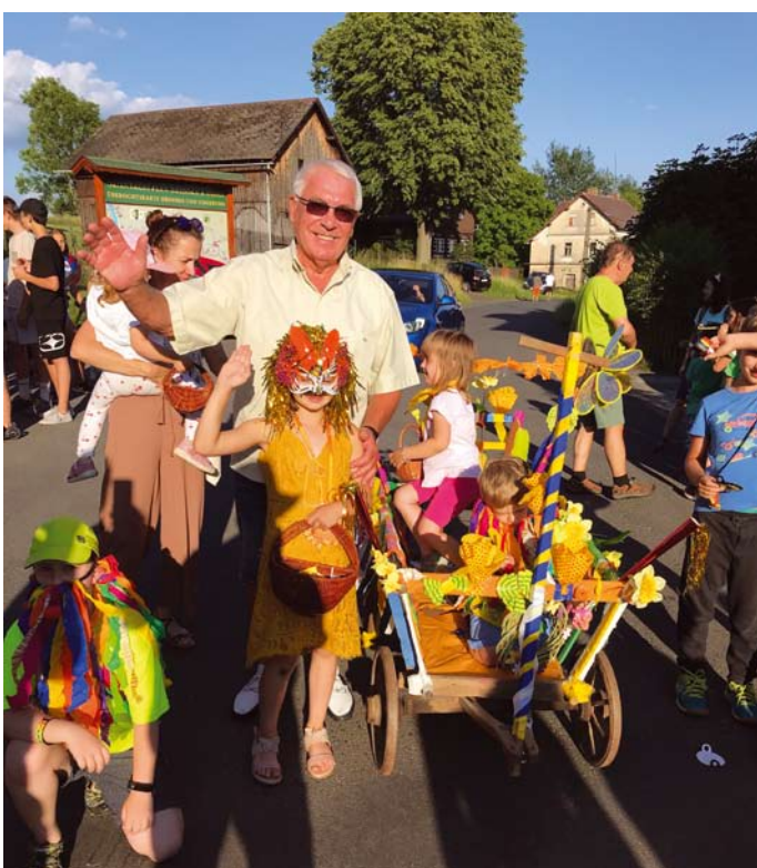
3. července se v „Kulturáku“ na Mezné uskutečnil netrpělivě očekávaný příjezd léta - více na str. 3

Správa Národního parku také děkuje všem, kdo respektují omezení vstupu do klidových území národního parku a do hnízdních lokalit. Právě díky jejich pochopení mohou druhy citlivé na rušení v klidu vyvádět své potomstvo.